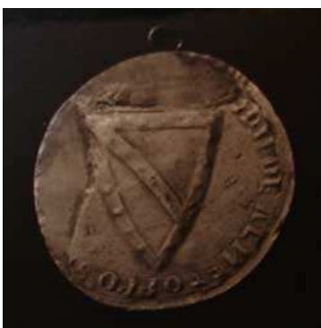
Gilles d'Aunay, 1245 (Inv. DOUËT D'ARCQ n°1238)