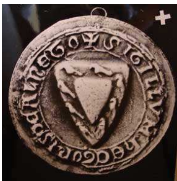
Hector d'Aulnois, 1231 (Inv. sceaux de Picardie, n° 106)