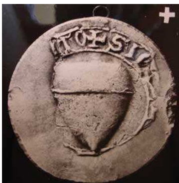
Gautier III d'Aunay chevalier, 1221 (Inv. sceaux de Picardie, n° 109)

G. DEMAY, Inventaire des sceaux de la collection Clairambault à la bibliothèque nationale , Paris, 1885-1886. G. DEMAY, Inventaire des sceaux de la Picardie recueillis dans les dépôts d'archives, musées et collections particulières des départements de la Somme, de l'Oise et de l'Aisne , Paris, 1875. L. DOUËT D'ARCQ, Catalogue Collection de sceaux , Paris, 1863-1868.