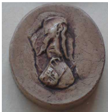
Pierre d'Aunoy chevalier capitaine de la ville cité et marché de Meaux, 31 décembre 1365 (CLAIRAMBAULT n° 440)