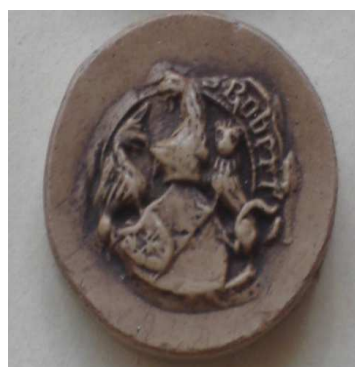
Robert d'Aunoy dit le Gallois chevalier, chambellan du Roi 13 septembre 1405 (CLAIRAMBAULT n° 442)