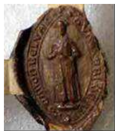
Gauthier chantre de Senlis, 1271 Arch.nat. S 5172 n°24